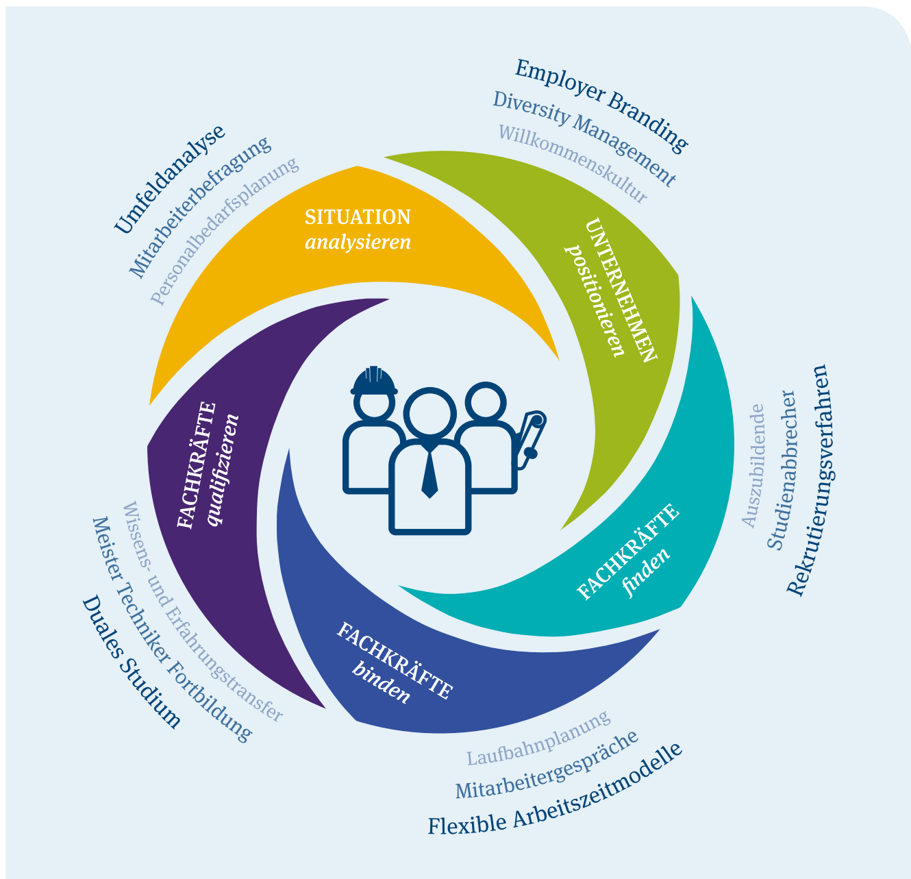
Abb. 3: Die fünf Handlungsfelder guter Personalarbeit sowie ausgewählte Maßnahmen, die Sie zukunftsfest machen

Bei der Entwicklung Ihrer Personalstrategie können Sie sich an den fünf Handlungsfeldern orientieren und die für Sie geeigneten Instrumente auswählen und umsetzen. In jedem dieser fünf zentralen Handlungsfelder gibt es Maßnahmen, die Ihnen helfen können, Ihre Personalarbeit an die Herausforderungen des demografischen Wandels anzupassen (Abbildung 3):