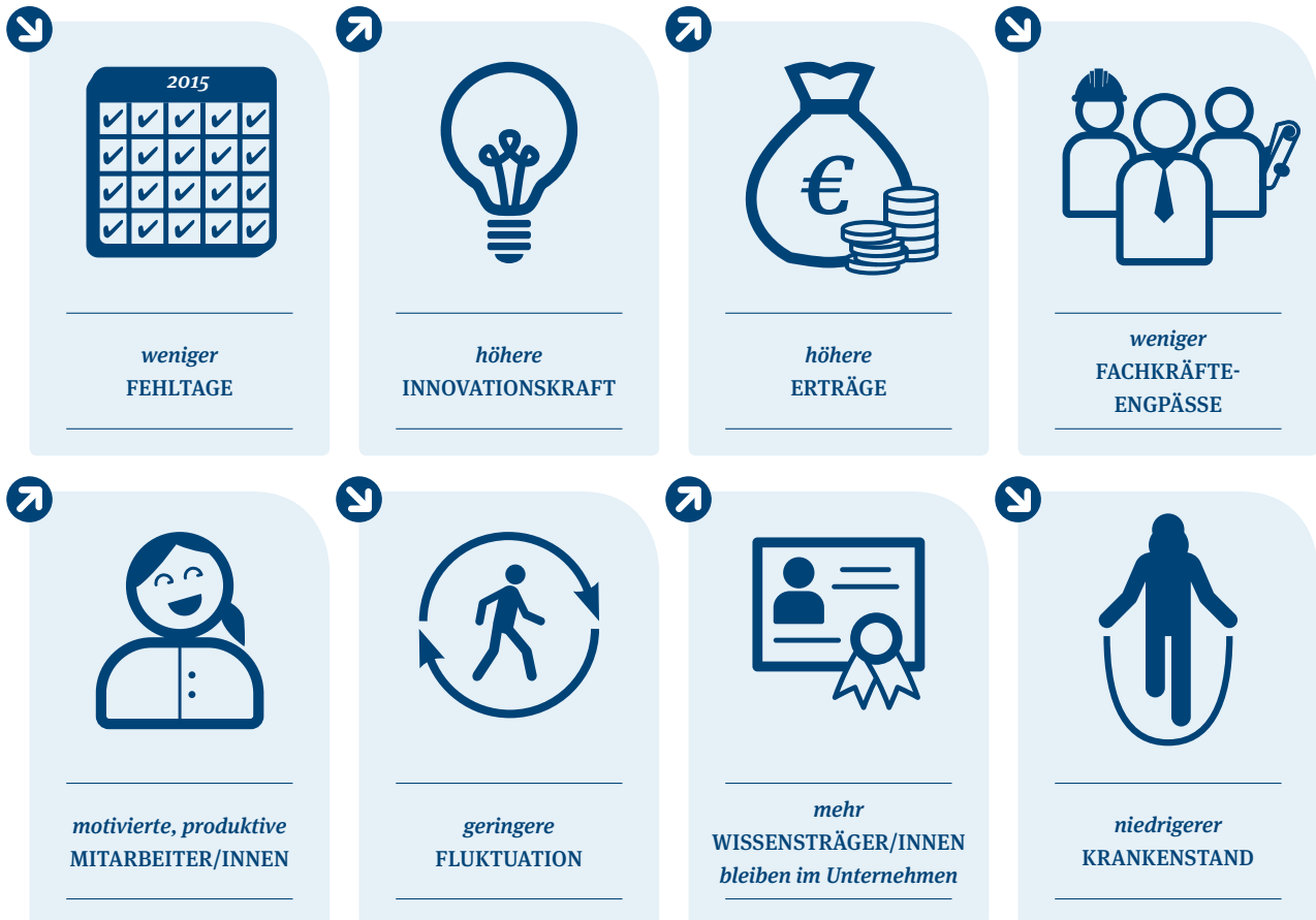
Abb. 2: Positive betriebswirtschaftliche Effekte