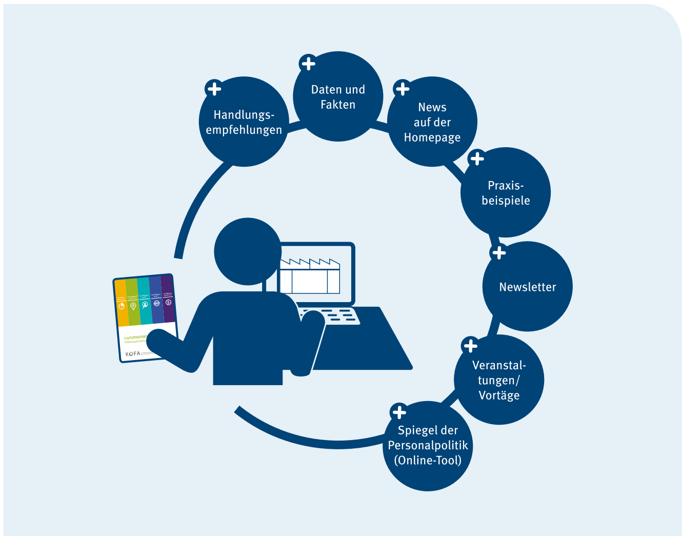
Abb. 5: Die Angebote des Kompetenzzentrums Fachkräftesicherung auf einen Blick

Unser Ziel im KOFA ist, Ihnen relevante Informationen für die Gestaltung einer guten und demografiefesten Personalarbeit zur Verfügung zu stellen – praxisnah, umsetzbar und mit leichtem Zugang. Wir verfolgen dabei folgende Ziele: