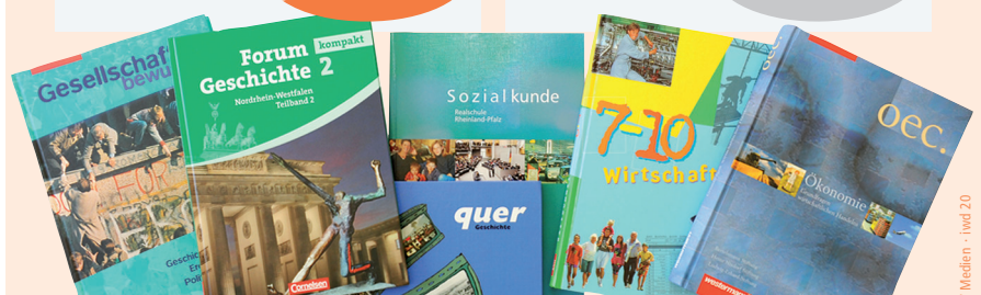
Schulbücher: Auswahl von 155 Schulbüchern, die für gesellschaftswissenschaftliche Fächer in der Sekundarstufe I und II zugelassen sind